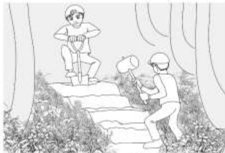
階段・ステップ切り