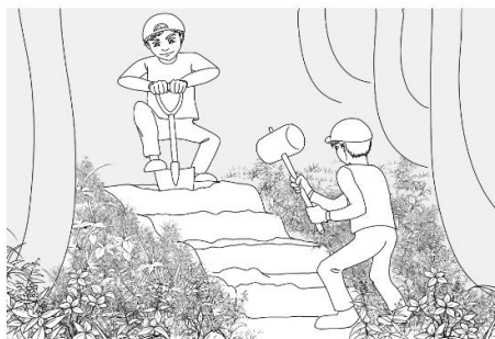
階段・ステップ切り